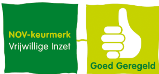
Logo van het NOV keurmerk

Het keurmerk is vier jaar geldig. In die tijd mag Weizigt de logo's gebruiken voor de eigen communicatie. Daarnaast wordt Weizigt vermeld als NOV-Keurmerkhouders op de website van de vereniging NOV.